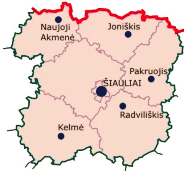
1 pav. „Šiaulių regiono ribos“

Atliekant šį tyrimą svarbiausia buvo išsiaiškinti tiksliai Šiaulių regiono ribas. (žr. 1 pav.) Toliau buvo naudojamos populiariausiomis CV, duomenų bazėmis, kuriuose įvedus į konkretų paieškos langelį „vadybininkai“, „Šiaulių miestas“ ir kitus priklausančius miestus Šiaulių regionui. Buvo išrinktos ir susistemintos 77 darbo pozicijos iš dirbam.lt, cv.online.lt, cvbankas.lt, uzt.lt.